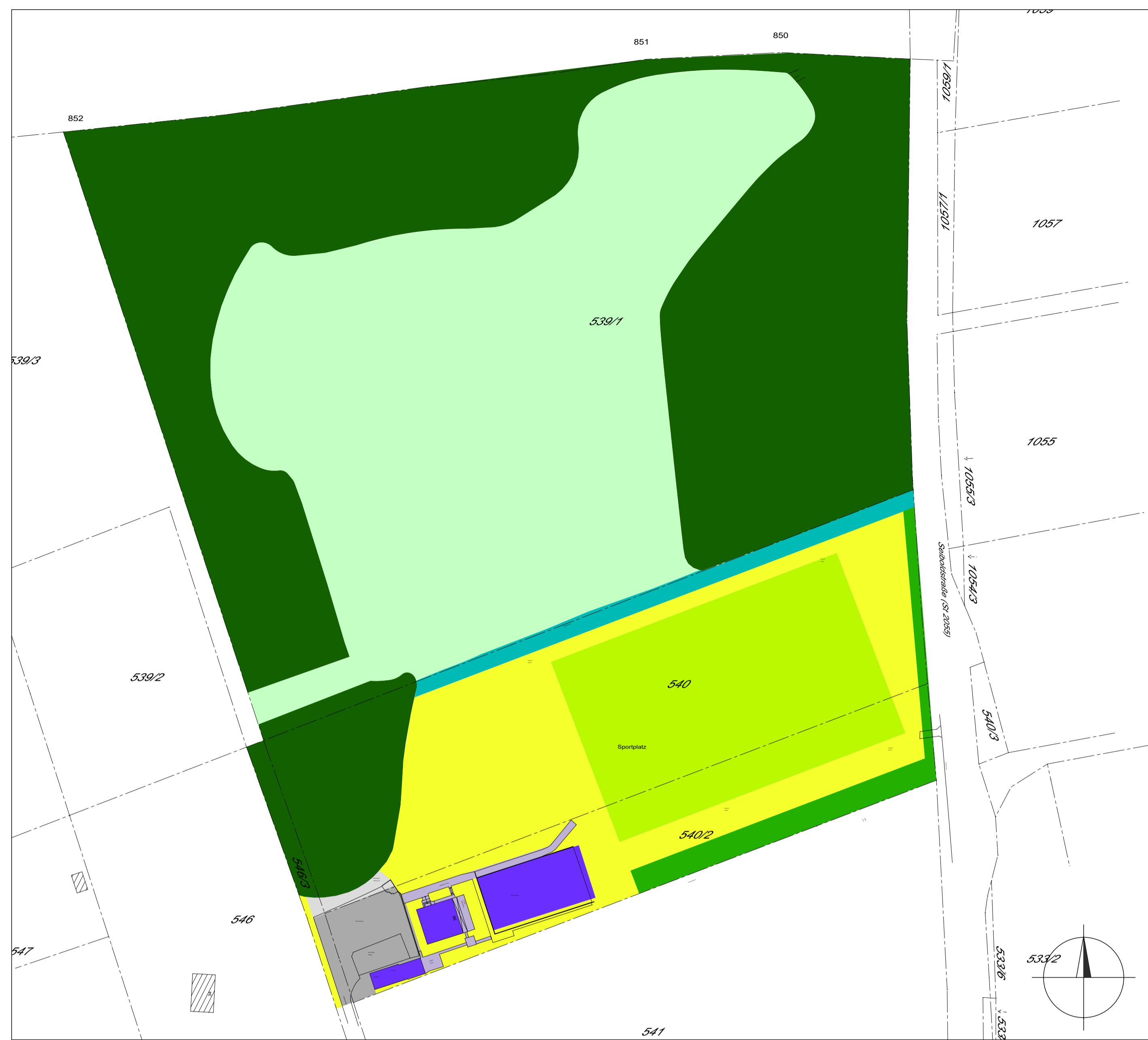
M 1 : 1.000